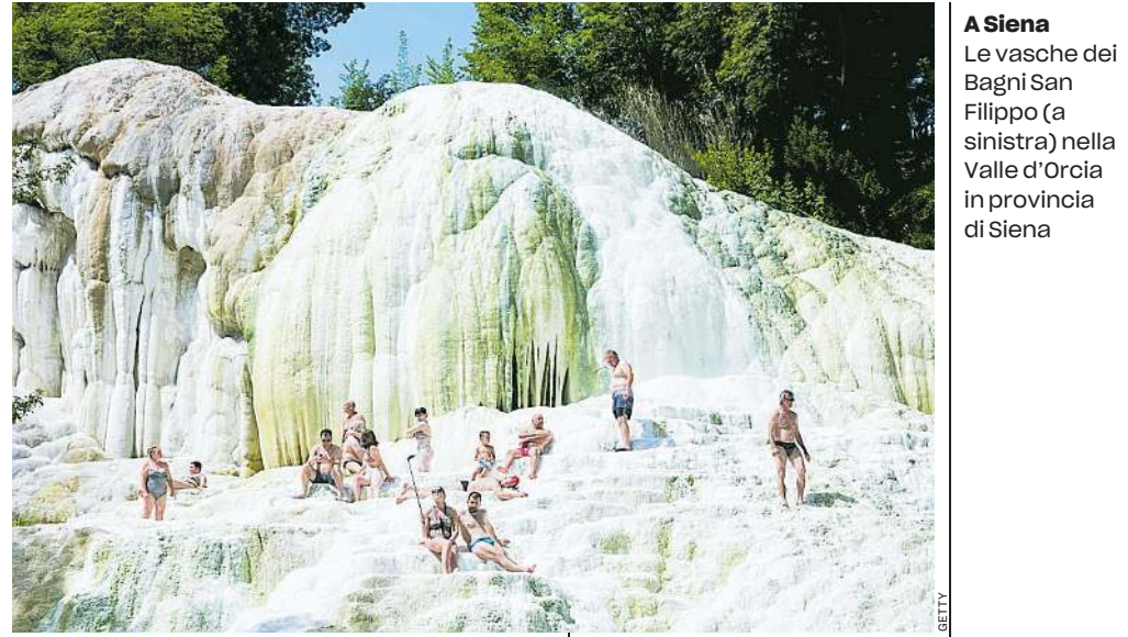
A Siena Le vasche dei Bagni San Filippo (a sinistra) nella Valle d'Orcia in provincia di Siena